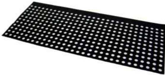
Tapis à trous standard