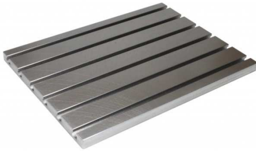
TABLE RAINURÉE ACIER