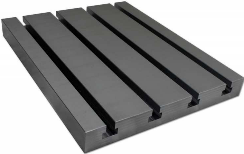
TABLE RAINURÉE ACIER ÉPAISSE

Application : Ces tables rainurées en acier C45 peuvent être bridées directement sur une table de machine ainsi que sur un plateau aspirant.