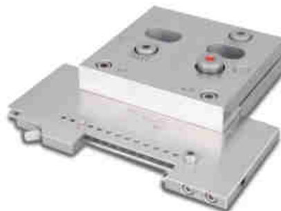
Etau WST monté sur l'embase