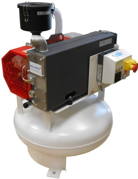
Groupe 42m 3 avec cuve tampon