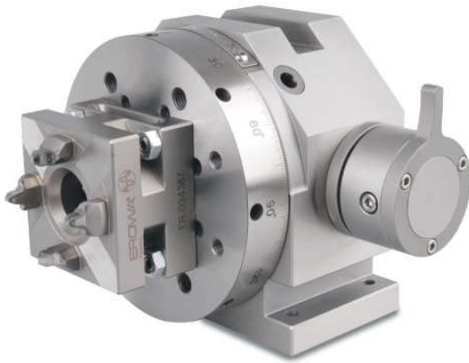
Mandrin Quick Change EROWA QC-50