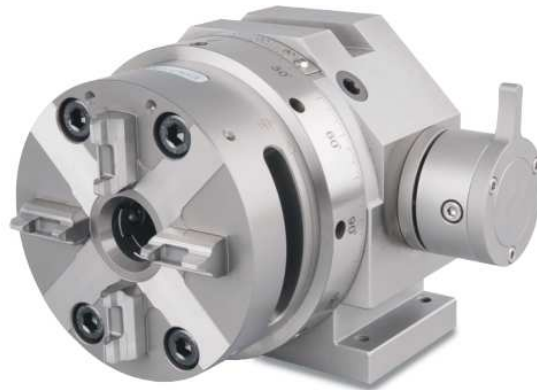
Mandrin Quick Change EROWA QC-100