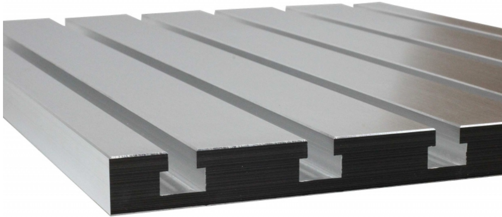
TABLE RAINURÉE ALUMINIUM

Application : Ces tables rainurées en aluminium massif peuvent être bridées directement sur une table de machine ainsi que sur un plateau aspirant.