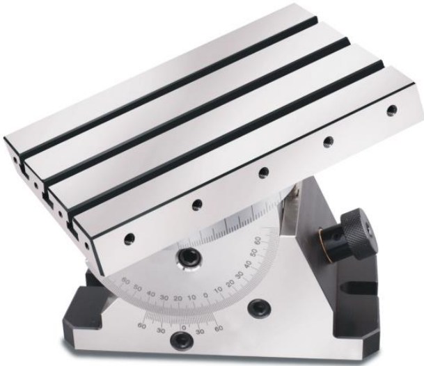
TABLE ORIENTABLE A RAINURES - TOR