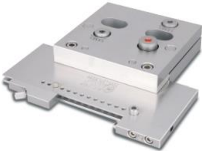
Etau WST monté sur la platine